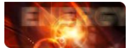
KIT-Zentrum Energie: Zukunft im Blick

Zu dem nun gestarteten Projekt „Entwicklung neuer Materialien und Devicestrukturen für konkurrenzfähige Massenproduktionsverfahren und Anwendungen der organischen Photovoltaik“ (POPUP) tragen insgesamt zehn führende Hochschulen, Forschungseinrichtungen und Unternehmen aus verschiedenen Bereichen bei. Die Koordination liegt bei dem Pharma- und Chemieunternehmen Merck. Das Gesamtbudget für das insgesamt drei Jahre laufende Projekt beträgt 16 Millionen Euro. Das Bundesministerium für Bildung und For-